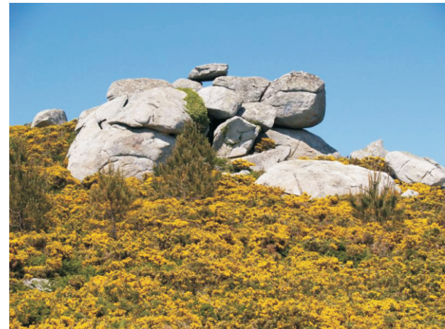
As Pedras Santas

Unha ruta circular na península de Fisterra para gozar das impresionantes vistas do “fin da terra”, nun lugar cheo de simbolismo, lendas e tradicións. Desde o cume do Facho podemos contemplar a enseada de Fisterra, o monte Pindo e a costa ata o monte Louro e máis alá, se está bo tempo. Cara ao norte vese o cabo da Nave.