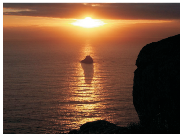
Solpor coa illa Centolo.