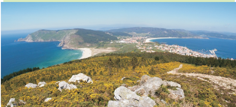
Vista desde o monte Facho sobre o istmo de Fisterra. Á esquerda a praia de Mar de Fóra e o Cabo da Nave.

Outra alternativa é facer a ruta desde o faro e rematala á caída do sol.