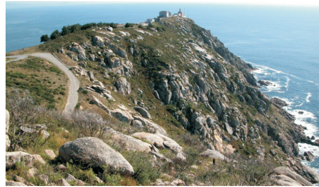
Faro de Cabo Fisterra